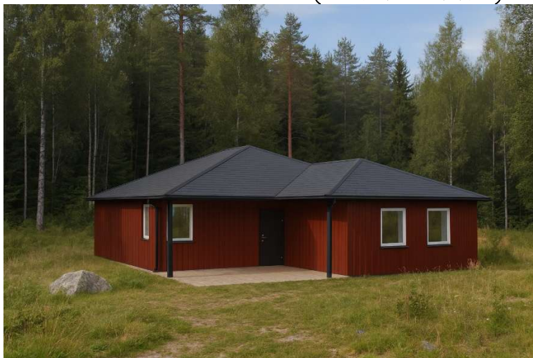
HUS - A