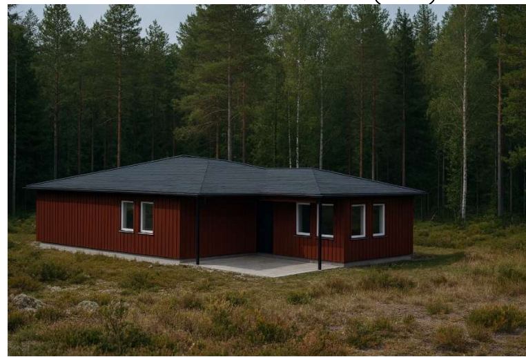
HUS - B